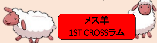
メス羊 1ST CROSSラム