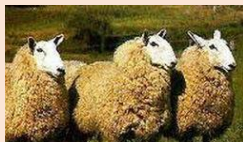
オス羊 BORDER LEICESTER(ボーダーレスター種)