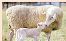
※オス羊 WHITE SUFFOLK(ホワイトサフォーク種)