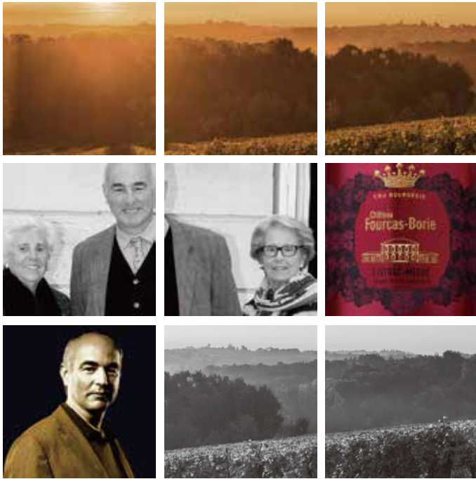
#シャトーフルカボリー #フランス #ボルドー