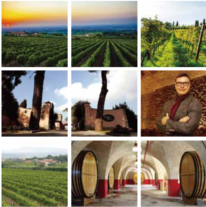
#ポッジョレヴォルピ #ゼットジンファンデル #イタリア #プーリア