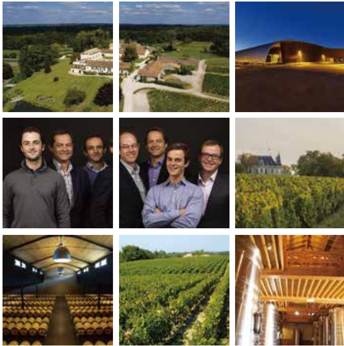
#メゾンシシェル #サンテミリオングランクリュ #フランス #ボルドー