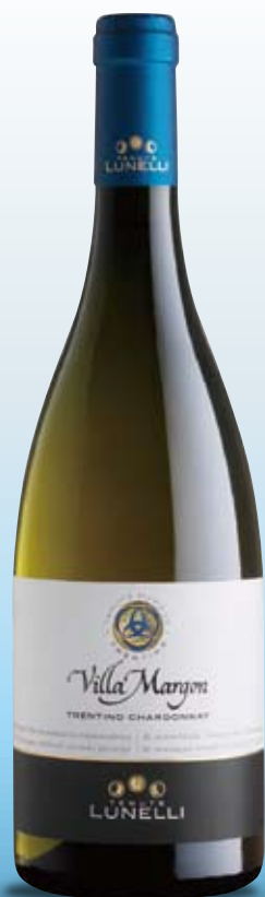
ヴィッラ・マルゴン Villa Margon