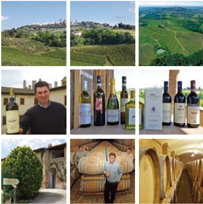
#ファルキーニ #ヴェルナッチャ #イタリア #トスカーナ