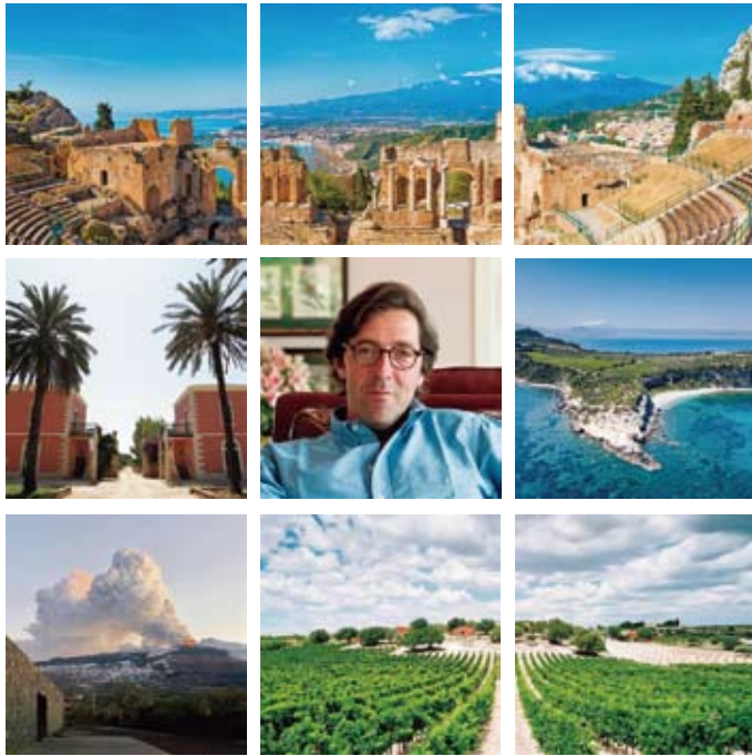
#プラネタ #アレマンダ #モスカート・ピアンコ #シチリア #持続可能なワイン造り