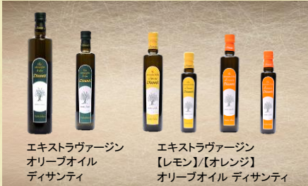
エキストラヴァージン オリーブオイル ディサンティ