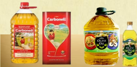
カルボネール オリーブオイルピュア