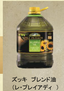
ズッキー ブレンド油 (レ・ブレイアディ)