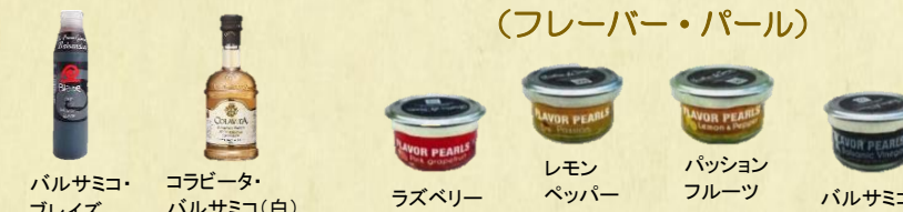
バルサミコ・ ブレイズ