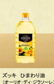
ズッキー ひまわり油 (オリーブ・ディ・ジラソレ)