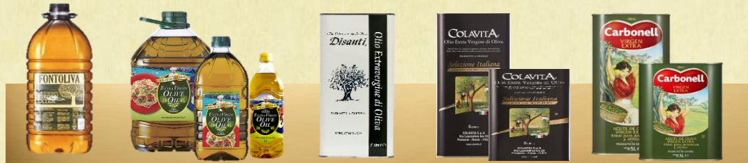
EXV オリーブオイル フロントリーヴァ