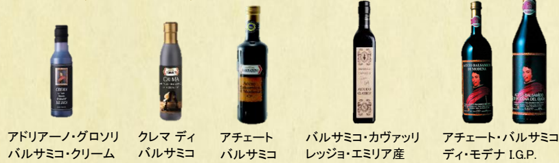
アドリアーノ・グロソリ バルサミコ・クリーム