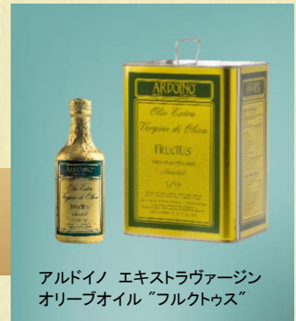
アルドイノ エキストラヴァージン オリーブオイル “フルクトゥス”