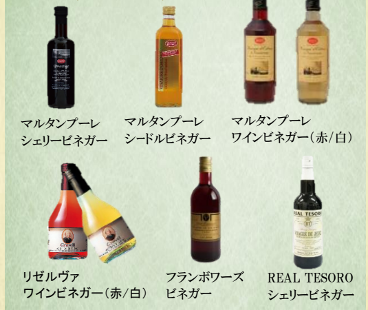
マルタンブール シェリーピネガー