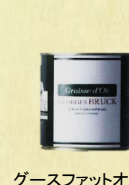
ゲースファットオイル