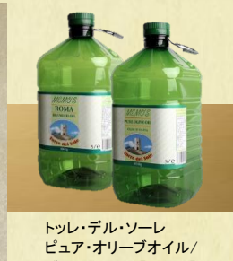
トルレ・デル・ソレ ピュア・オリーブオイル/ ブレンドオイル【ローマ】