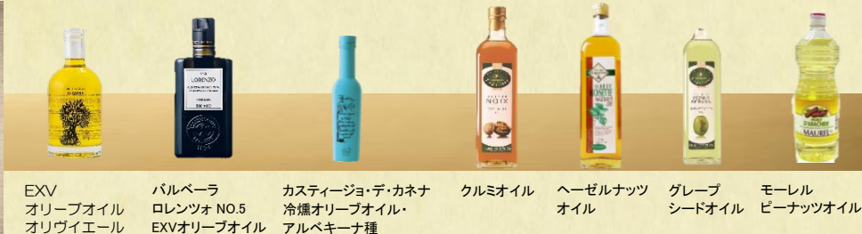
EXV オリーブオイル オリヴィエール